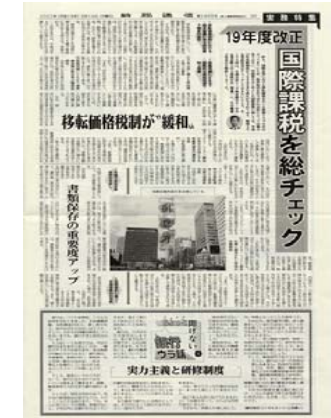
政府・国税庁等の動きを わかりやすく解説