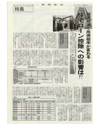
不動産関連税務特集