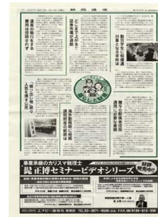
時事情報・税務情報